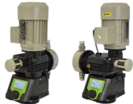
PUMPENKÖRPER AUS EDELSTAHL